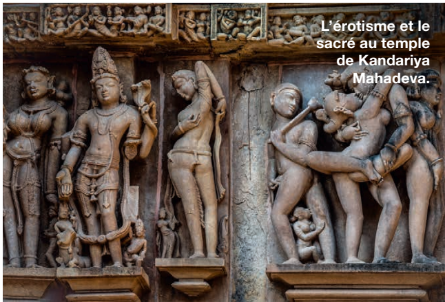
L'érotisme et le sacré au temple de Kandariya Mahadeva.