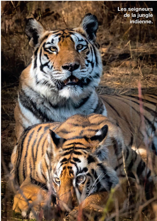
Les seigneurs de la jungle indienne.