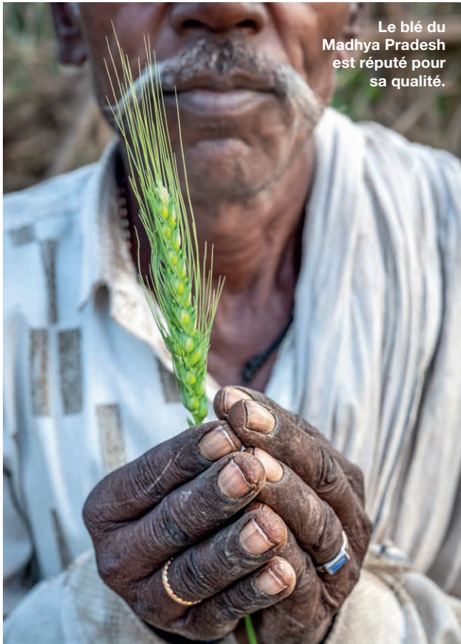
Le blé du Madhya Pradesh est réputé pour sa qualité.