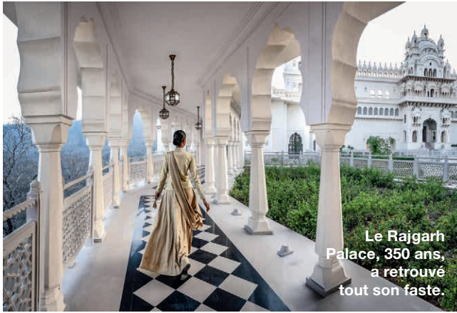
Le Rajgarh Palace, 350 ans, a retrouvé tout son faste.