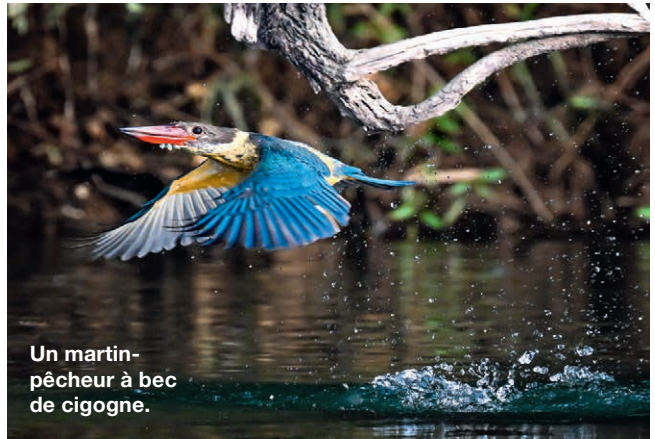
Un martin-pêcheur à bec de cigogne.