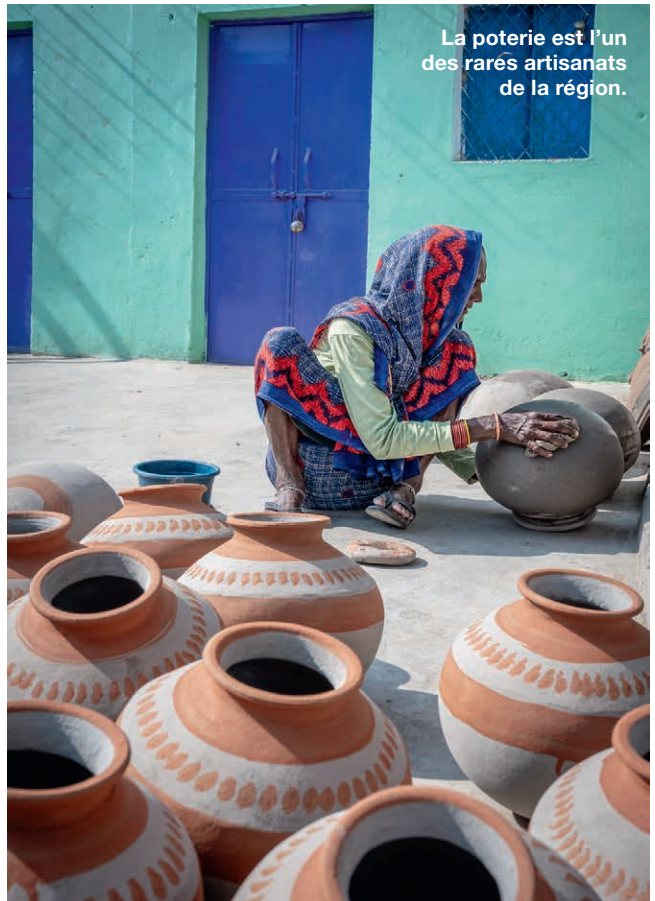
La poterie est l'un des rares artisanats de la région.