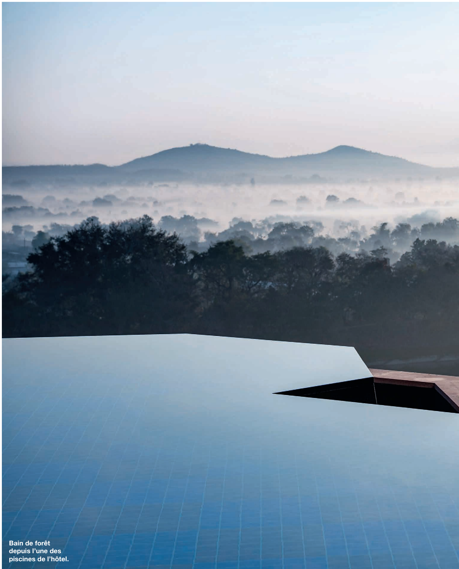
Bain de forêt depuis l'une des piscines de l'hôtel.