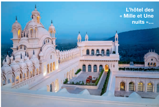
L'hôtel des « Mille et Une nuits »...