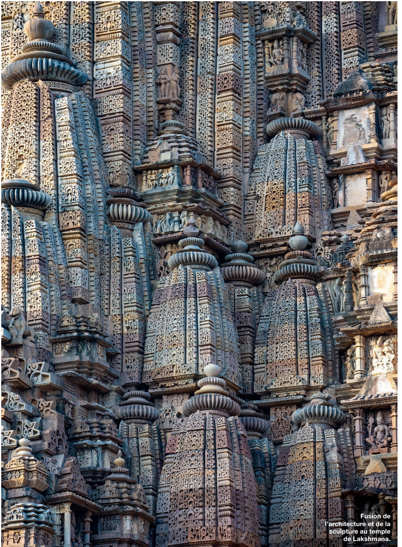
Fusion de l'architecture et de la sculpture au temple de Lakshmana.