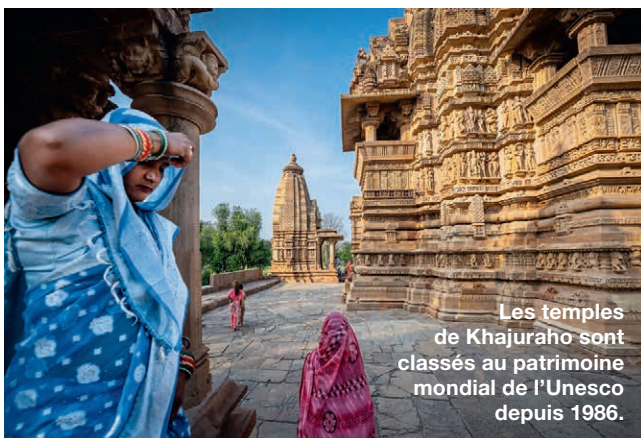
Les temples de Khajuraho sont classés au patrimoine mondial de l'Unesco depuis 1986.