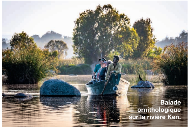
Balade ornithologique sur la rivière Ken.